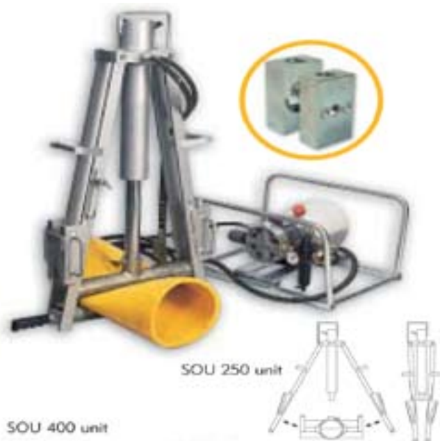
SOU 400 unit