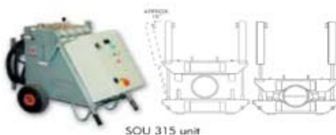
SOU 315 unit